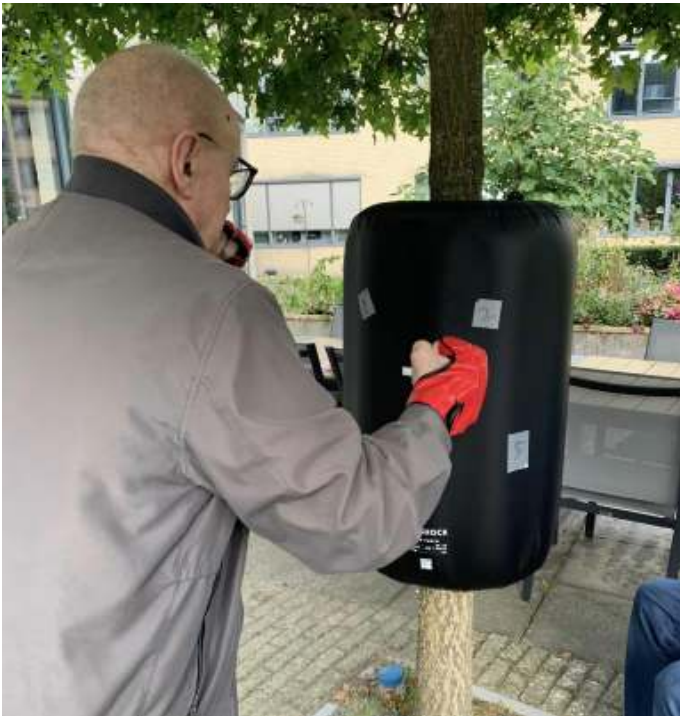
Buiten sporten nu het nog kan! Dubbel genieten van het zonnige herfstweer.

"Eet meer appeltaart" is de leuze van de stichting Appeltaartconcerten. Dat hopen we zeker en binnen afzienbare tijd te doen.